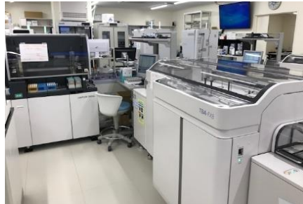
生化学自動分析装置