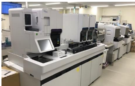
血液凝固自動分析装置

これからも様々な診療ニーズに柔軟に対応していけるよう努力していきたいと考えています。皆さまこれからもよろしくお願いいたします。