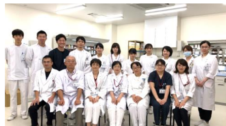
薬剤部の皆さん大集合！

薬剤部では患者さんに安心して適切な薬物療法を受けていただくため、医薬品の適正使用の推進、患者サービスの向上、チーム医療の充実を3本柱として医薬品の有効性と安全性を確保し、適正な薬物療法を推進しています。新病院では、最先端の高度な調剤支援システムを種々導入することで、より正確かつ迅速な調剤業務（内服・外用・注射）や抗がん剤の調製が可能になるとともに、システムによる処方チェックの充実化等により、安全で安心な医薬品の提供（調剤）の推進を図ることができました。また、服薬指導支援システムや抗菌薬適正使用支援システム等の充実化に加えて薬剤部職員の増員により、服薬指導の業務範囲の拡大やチーム医療への積極的参加が可能となりました。特に抗菌薬適正使用支援チーム（AST）では、薬剤師が中心となって抗菌薬の適正使用推進に努めています。