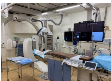
パイプライン血管撮影装置