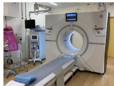
256 列 CT

放射線部では、安心安全な質の高い医療を提供できるよう技術の向上に努め、被ばく低減を図り、専門性の高い人材育成にも力を入れていきますので、今後ともよろしくお願い致します。