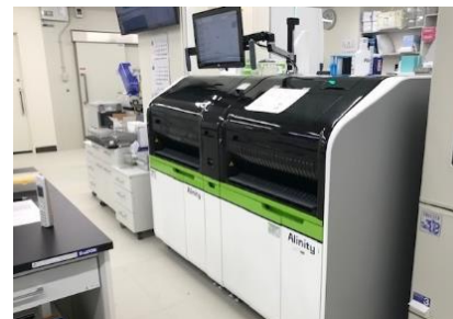
免疫自動分析装置