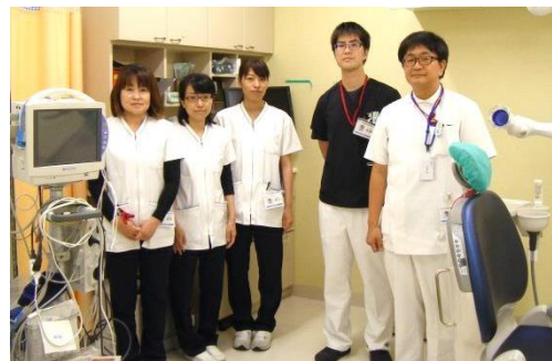
歯科口腔外科のスタッフです！