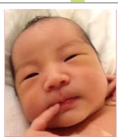
芦田 りつ 梨月 ちゃん